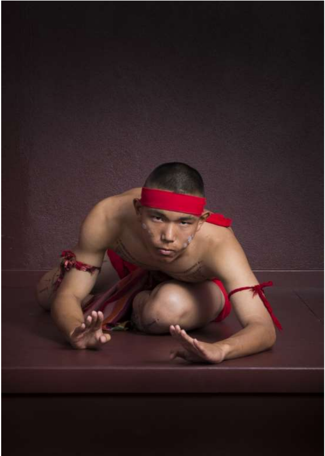
ท่าเตี้ยต่ำเสื่อหมอน