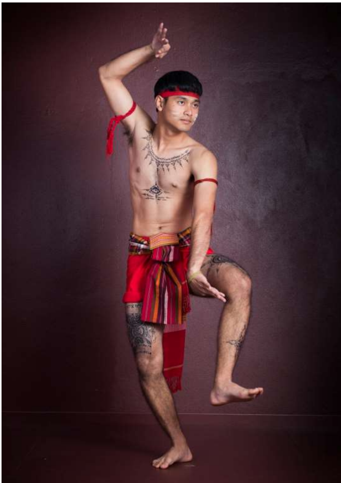
ท่าพ้าวเสี้ยวไผ่