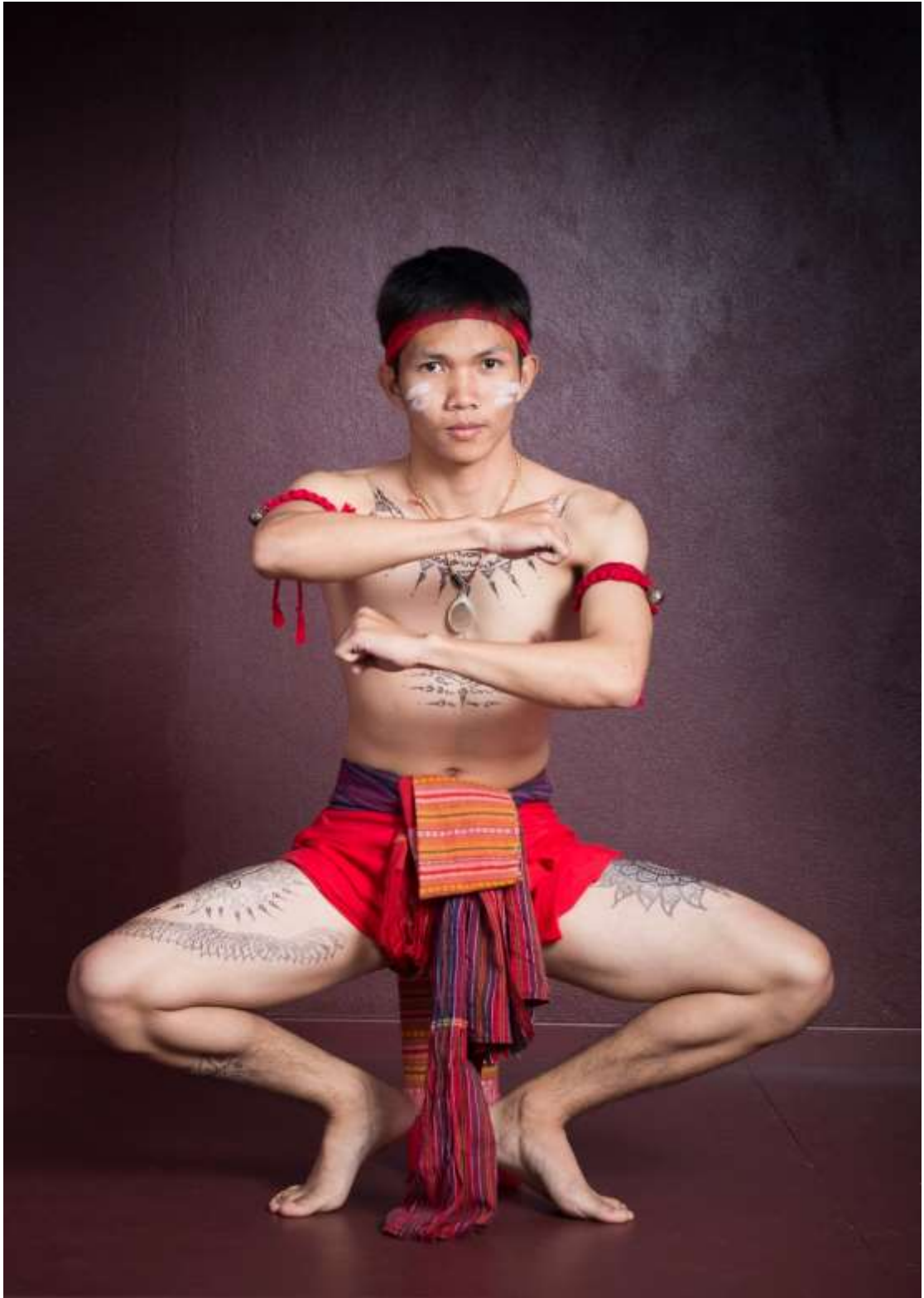
ท่าสั่นหอก โหมกชดักดี