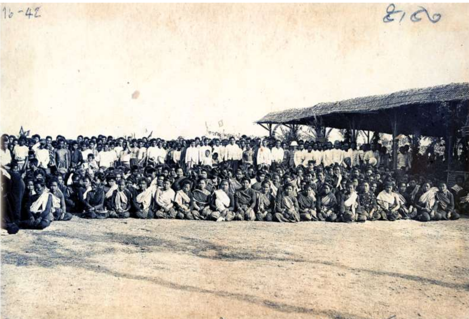
ราษฎรชาวสกจนครจากหลายกลุ่มชาติพันธุ์ ใ้เข้ารับเสด็จ พระเจ้าพี่นางเธอ กรมหลวงดำรงราชานุภาพ (พระยศไพบุณเฑาะพื้) เสด็จมาดึกระทรวงมหาดไทย เมื่อคราวเสด็จตรวจราชการมณฑลอิสาน โดยประทับ ณ เมืองสกจนครระหว่างวันที่ ๑๔ - ๑๖ มกราคม พ.ศ. ๒๔๘๙