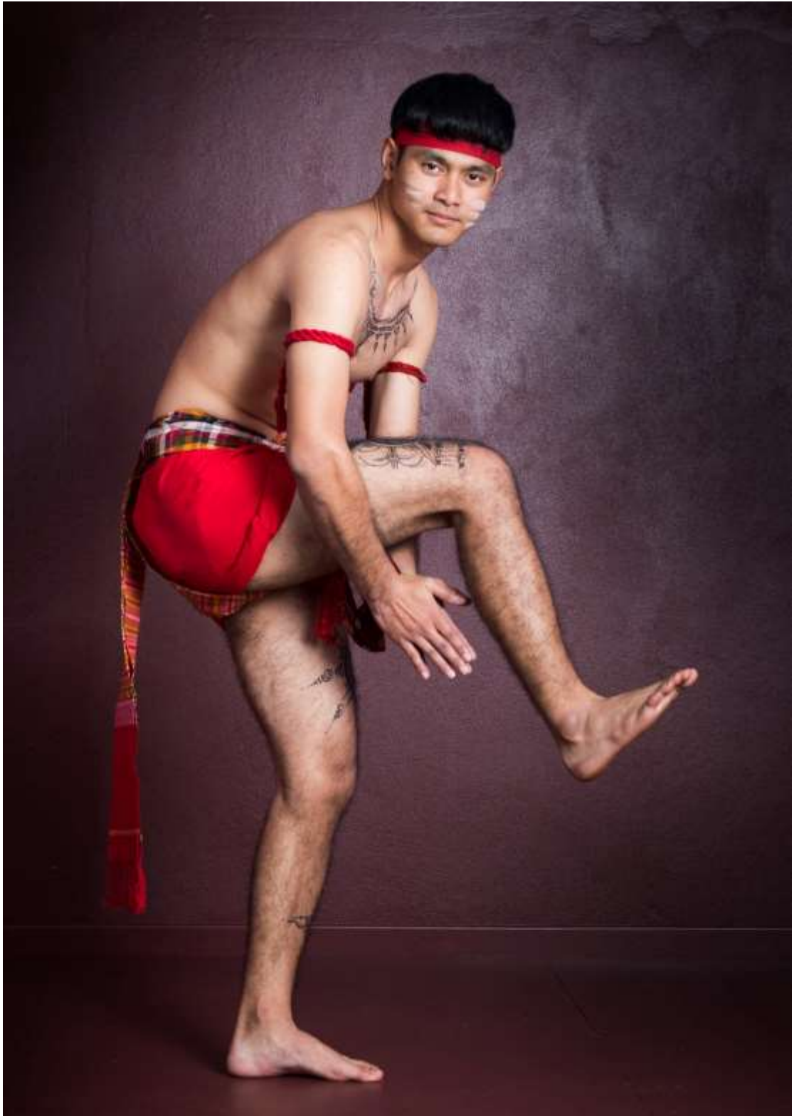
ท่าตบผามปราณมาร