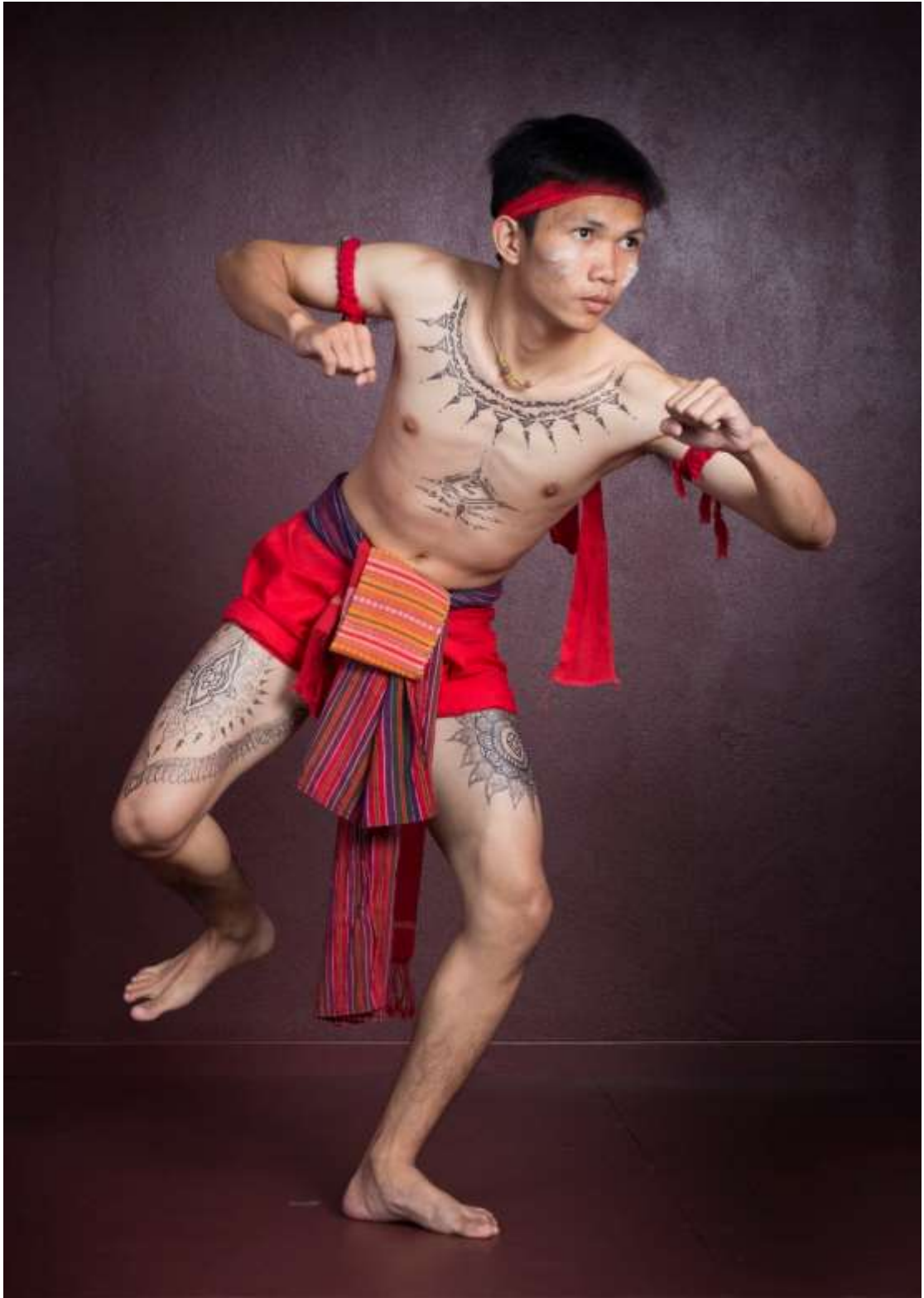
ท่าไก่เลี่ยนเล้า