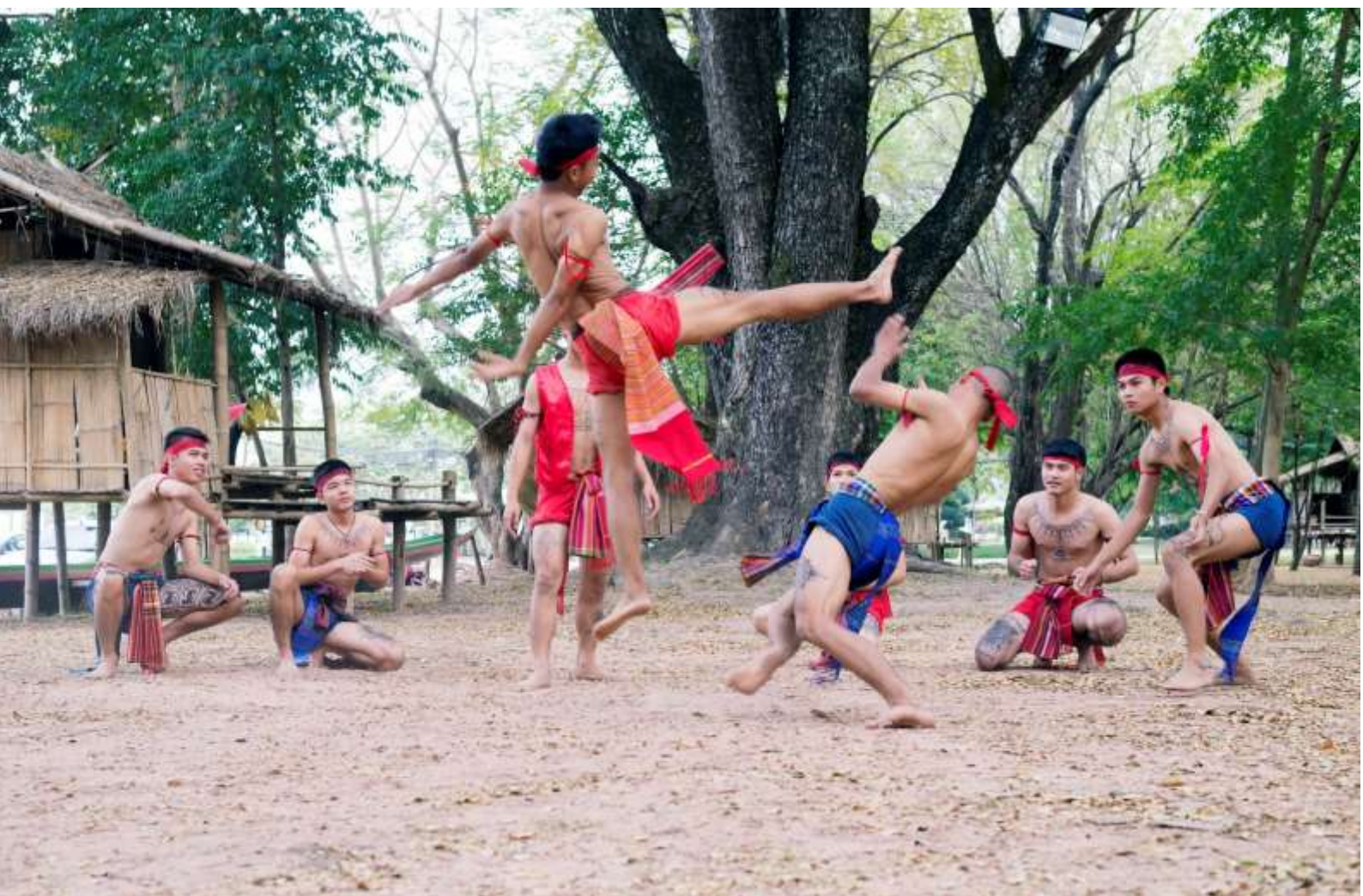
การแสดงมวยโบราณประเภท “ต๋อสู๋” หรือ “ตีมวย”