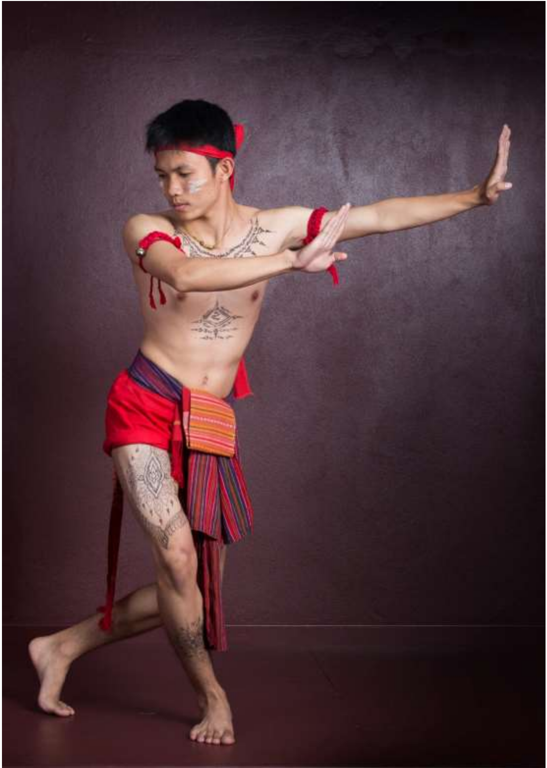
ท่าทะยานเหยื่อ เสียดลากหาง กวางเหลียวหลัง