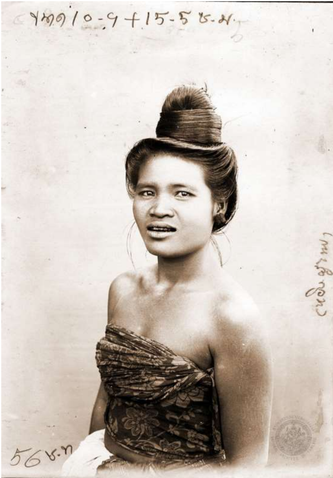
สตรีกลุ่มชาติพันธุ์กูไท มณฑลอุดร ถ่ายเมื่อพุทธศักราช ๒๔๘๙