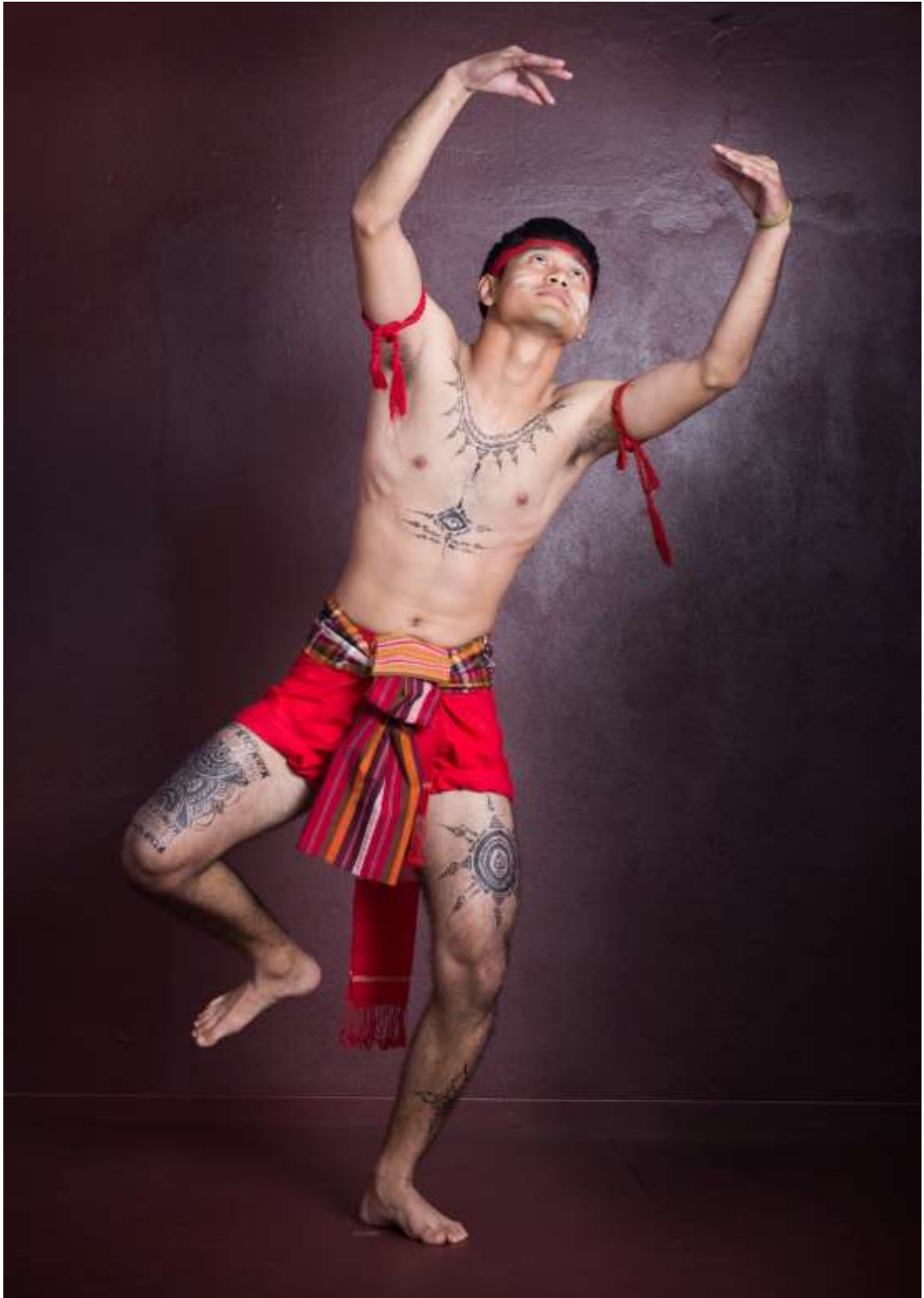
ท่าหระพราย