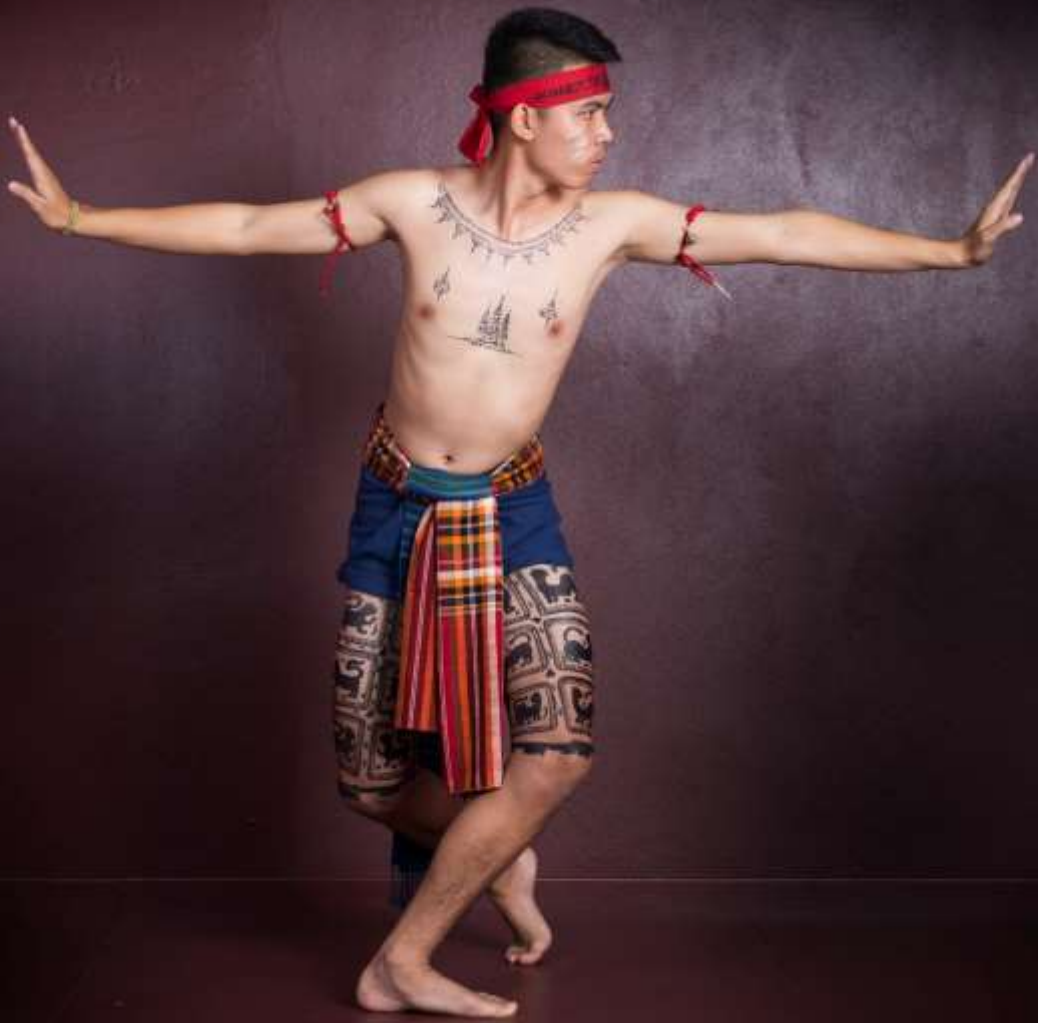
ท่าแหลวงสา กาทากปีก