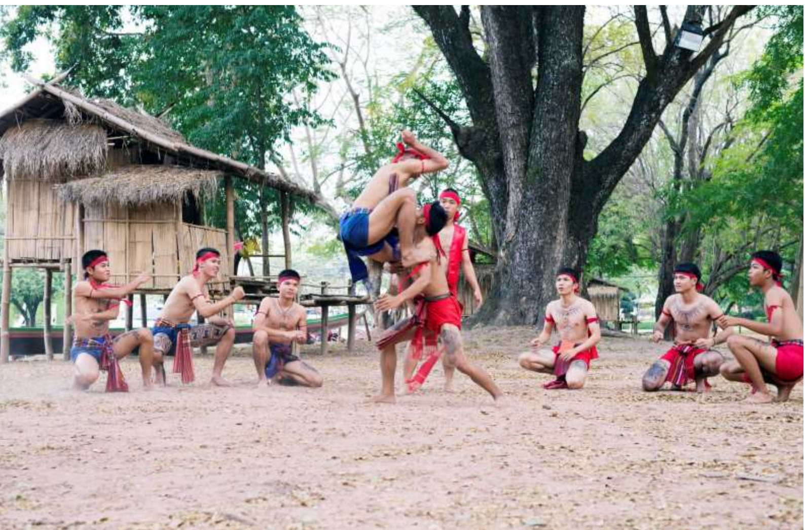
การแสดงมวยโบราณประเภท “ต๋อสู๋” หรือ “ตีมวย”