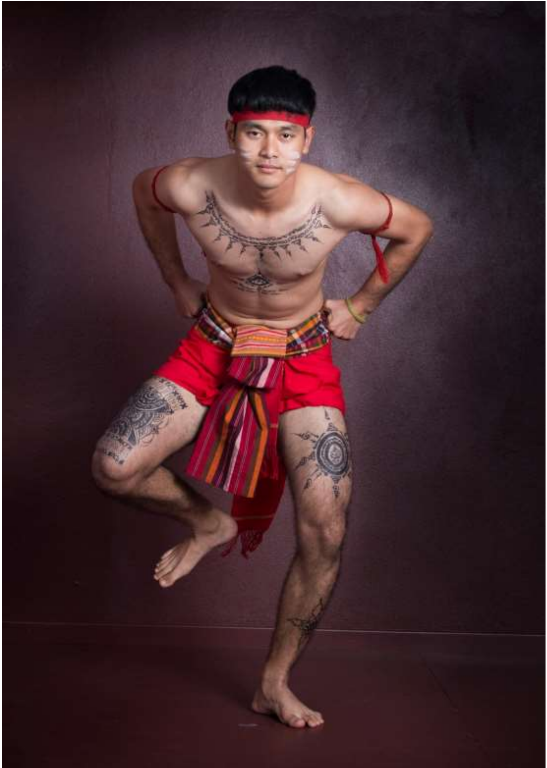
ท่ากาเต๋นกำพ็ไถ