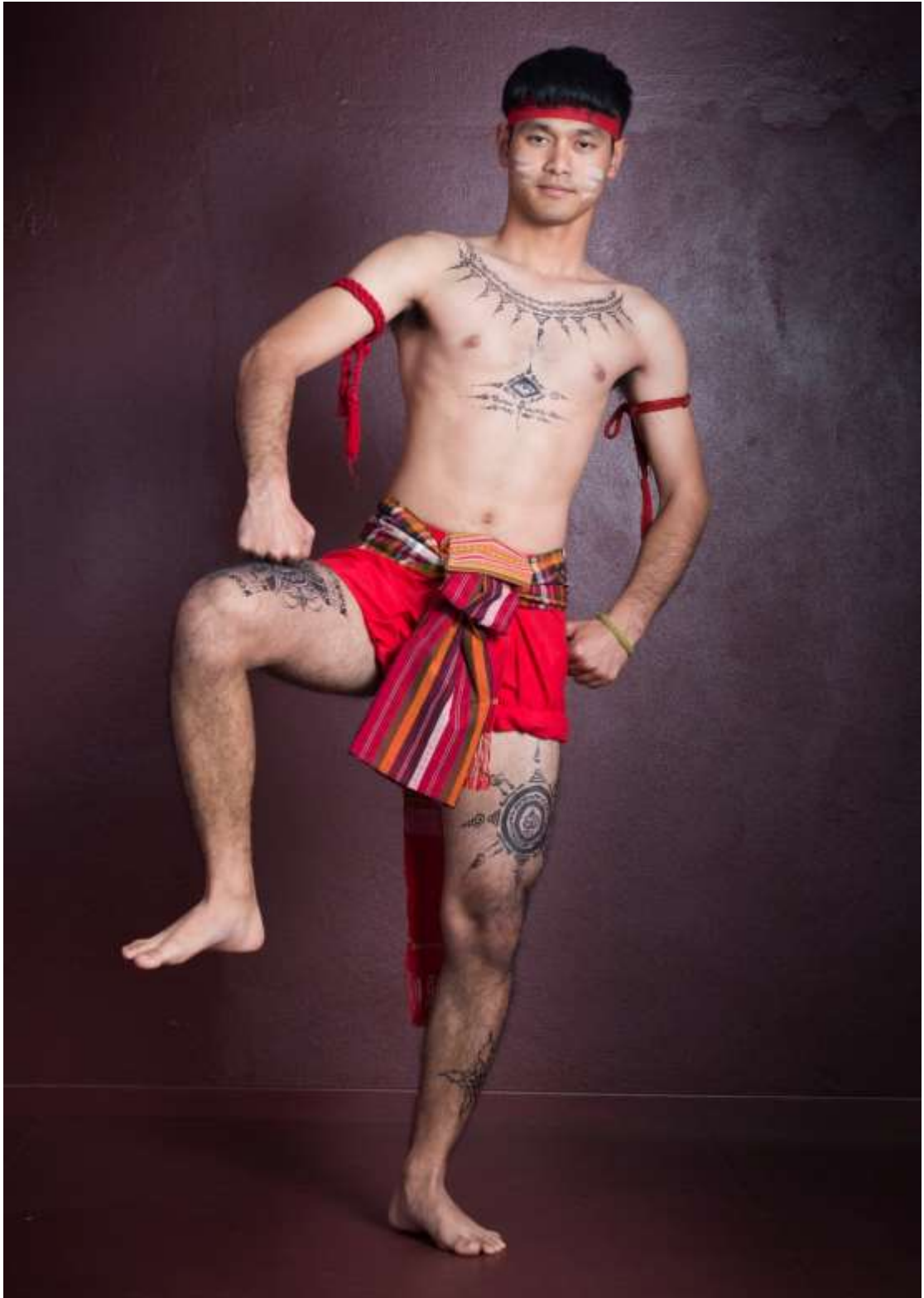
ท่าข้ามสามเส้า