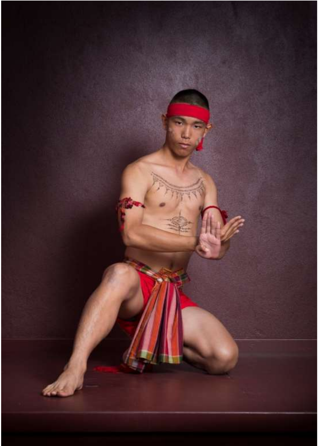
ท่าส่อแก้วเมกขสา