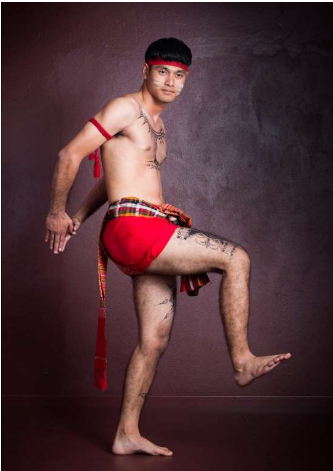
ท่าไส่ลูกแตก