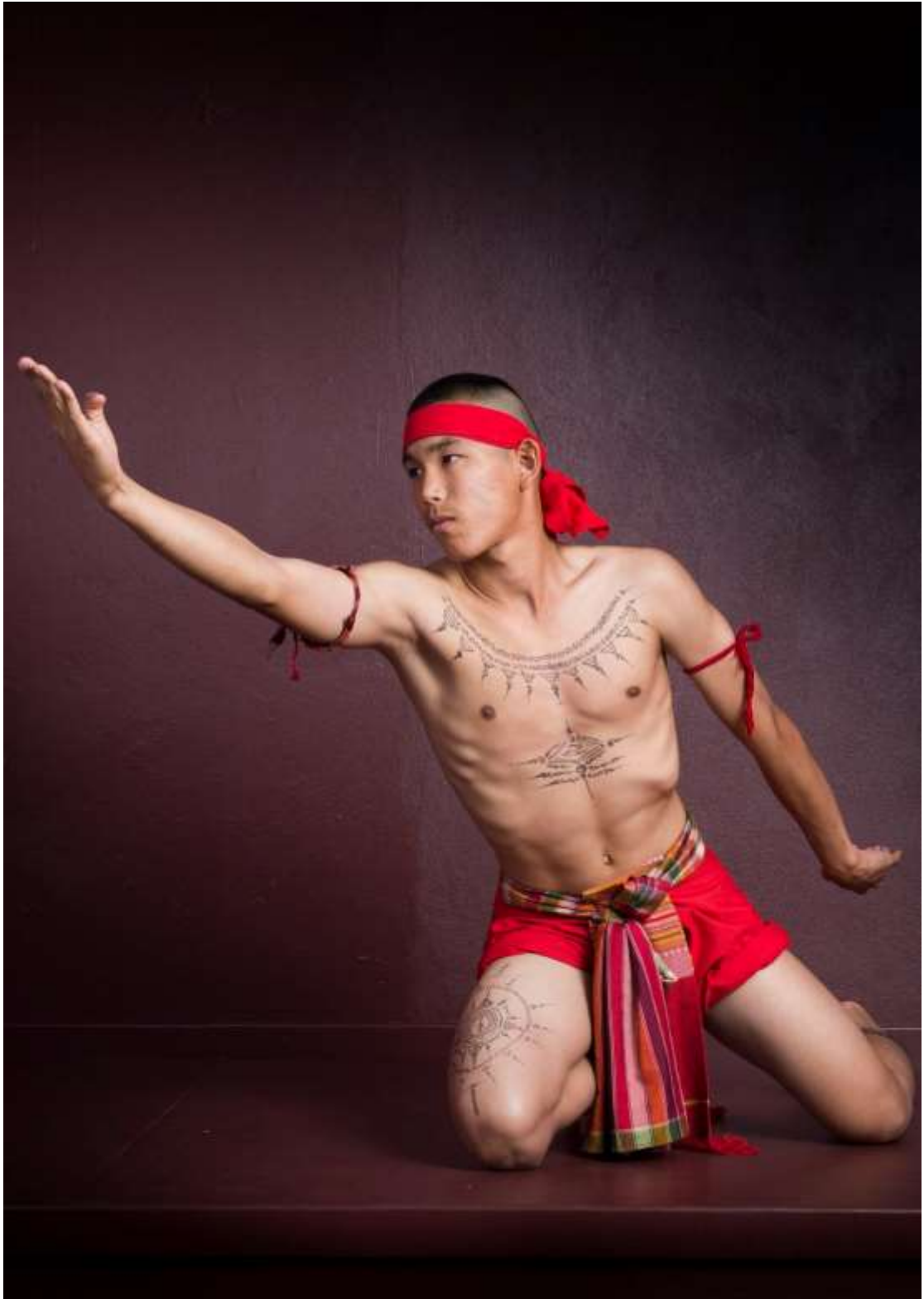
ท่ากัฬรเข้ถ้ำ

ที่มา : พิพิธภัณฑ์เมืองสกลนคร มหาวิทยาลัยราชภัฏสกลนคร