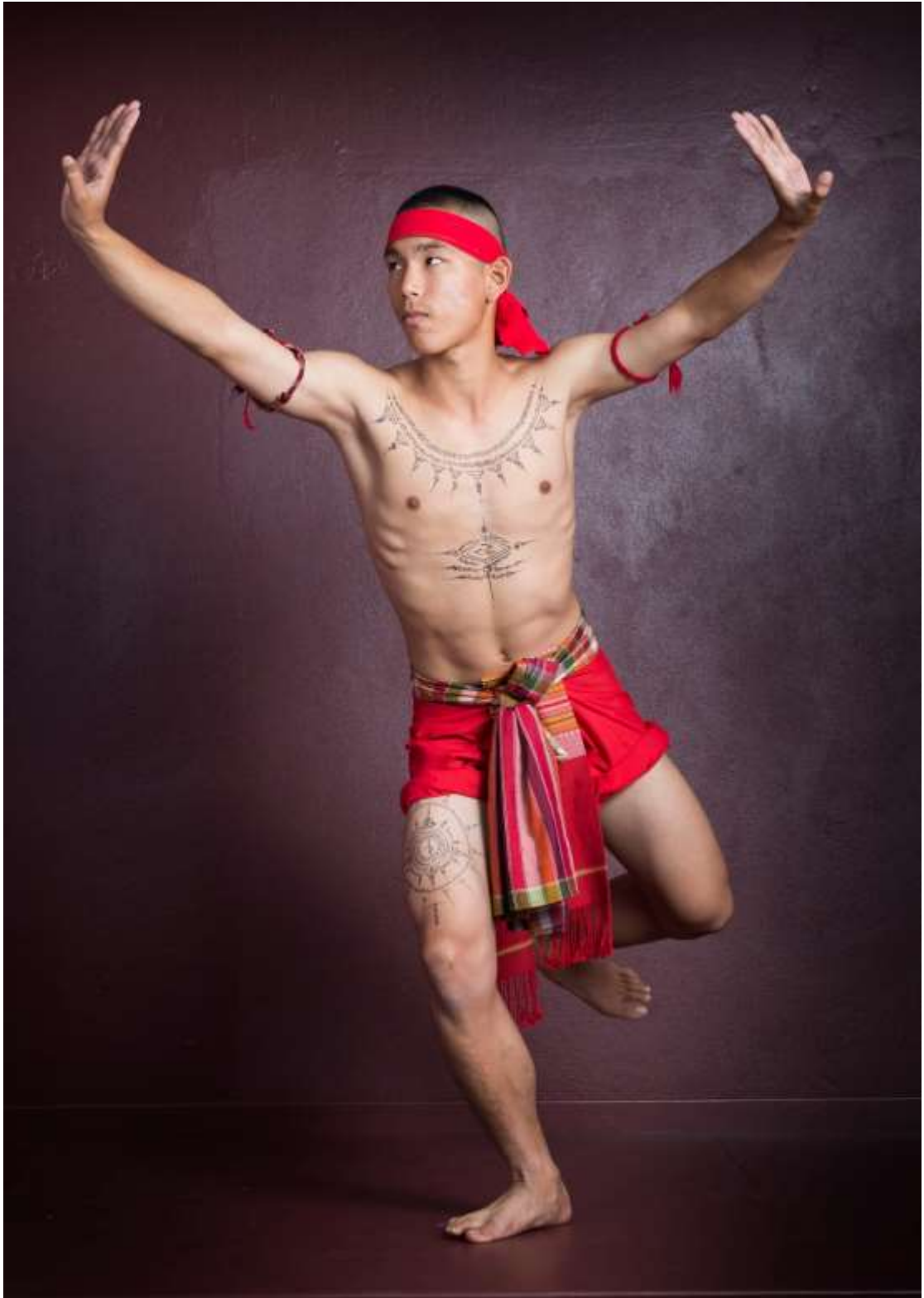
ท่าช้าง ไหลงทะเลสาบป่า