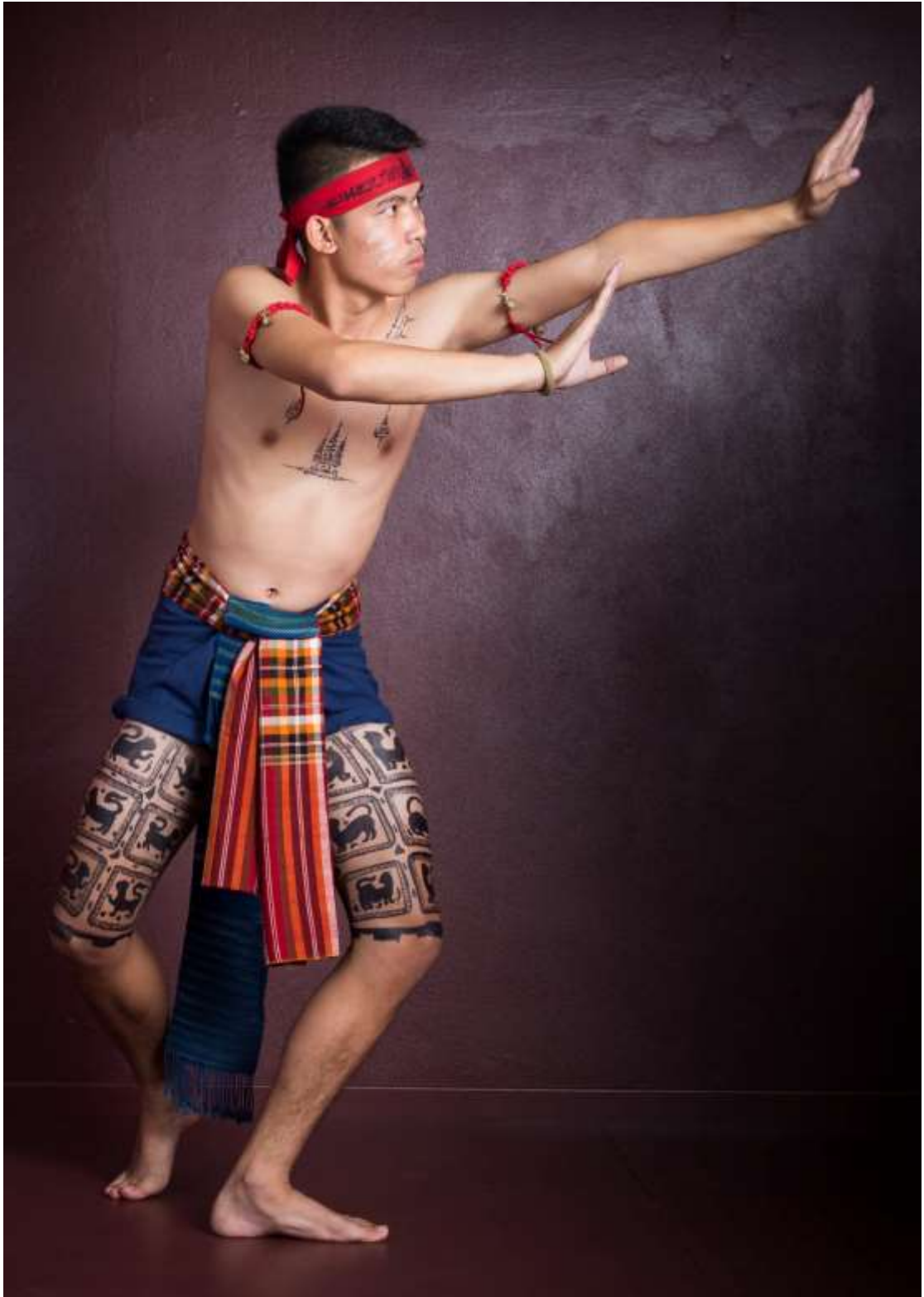
ท่าทวงฉัก กวักชู