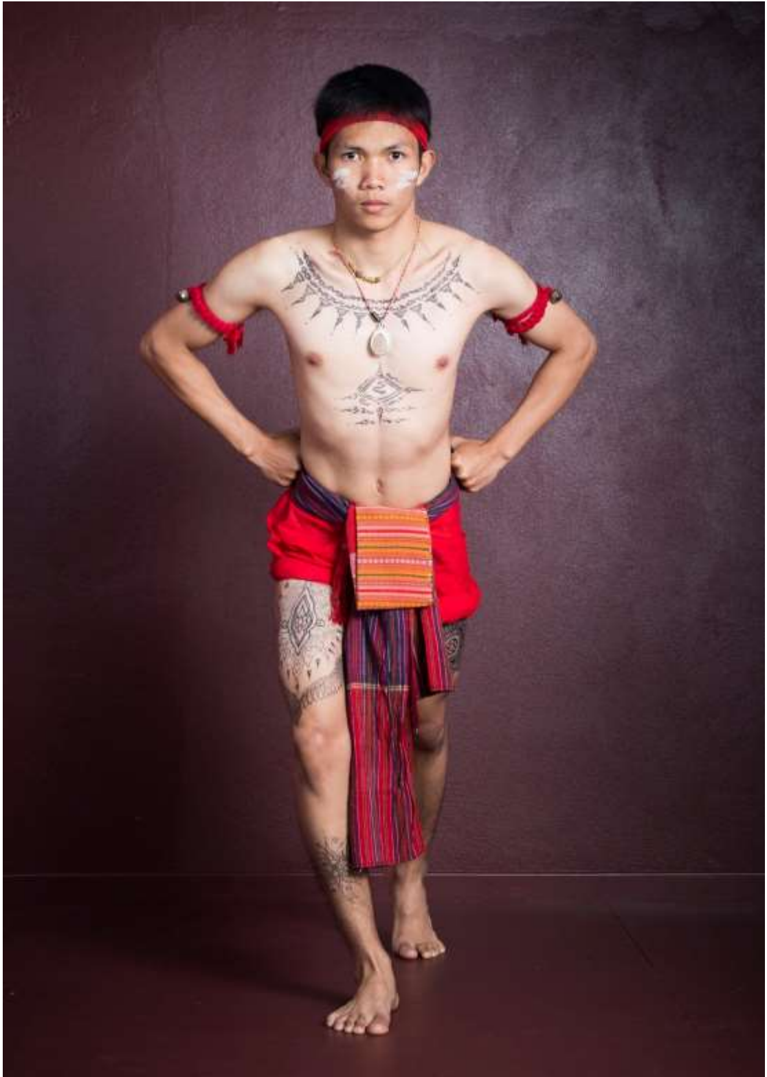
ท่าเสียดอกเหล่า