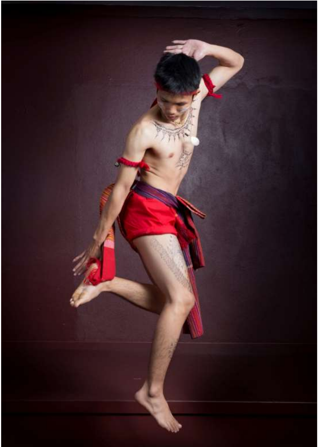
ส่วนหนึ่งของท่าเสียดอกเหล่า