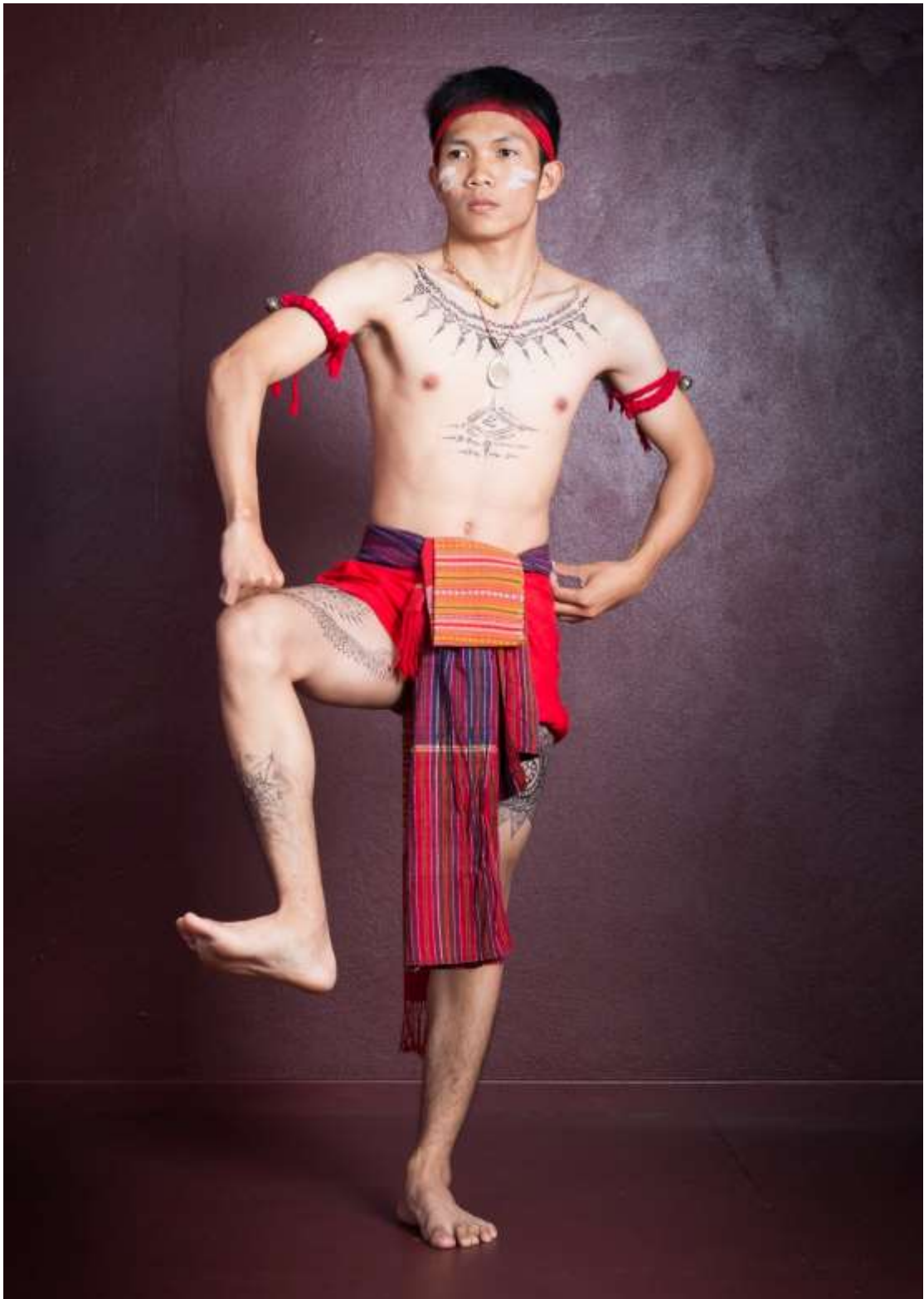
ท่าช่างสามชุก