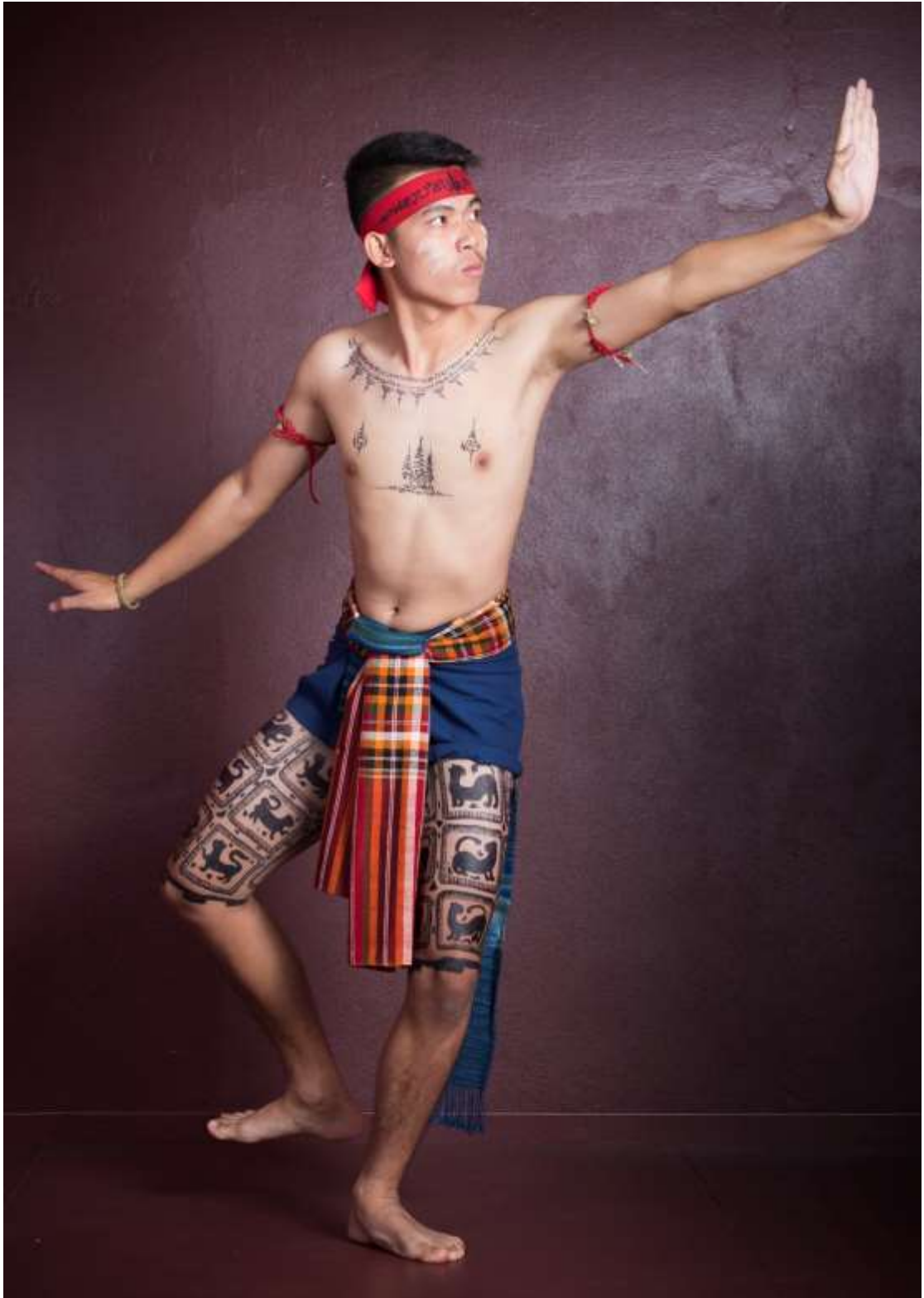
ท่าเลาะเลียนตุบ