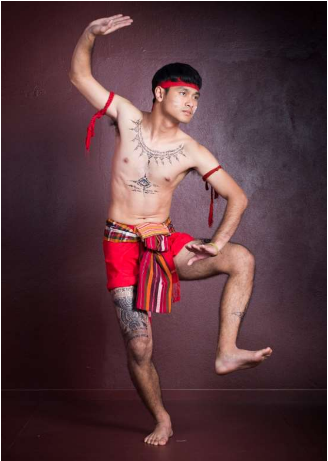
ท่ากุ่มกัณฑ์ถอยทัพ