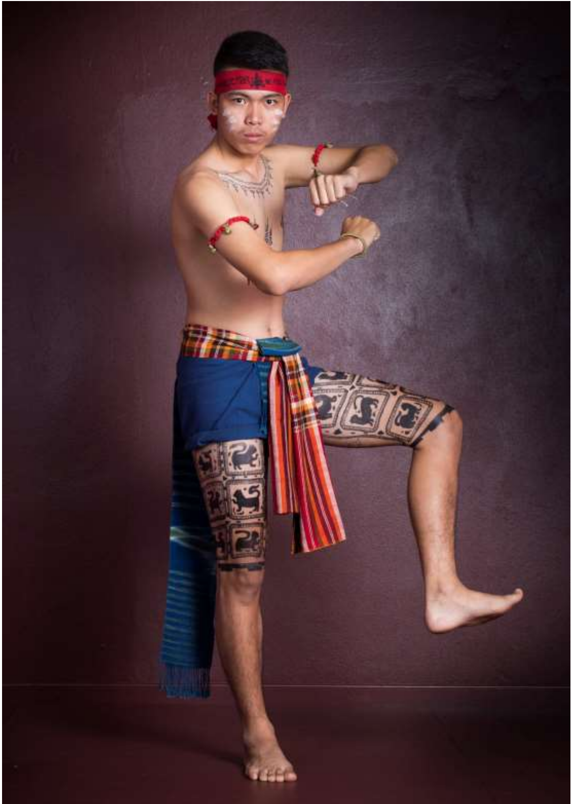
ท่าช้างมัวพวง