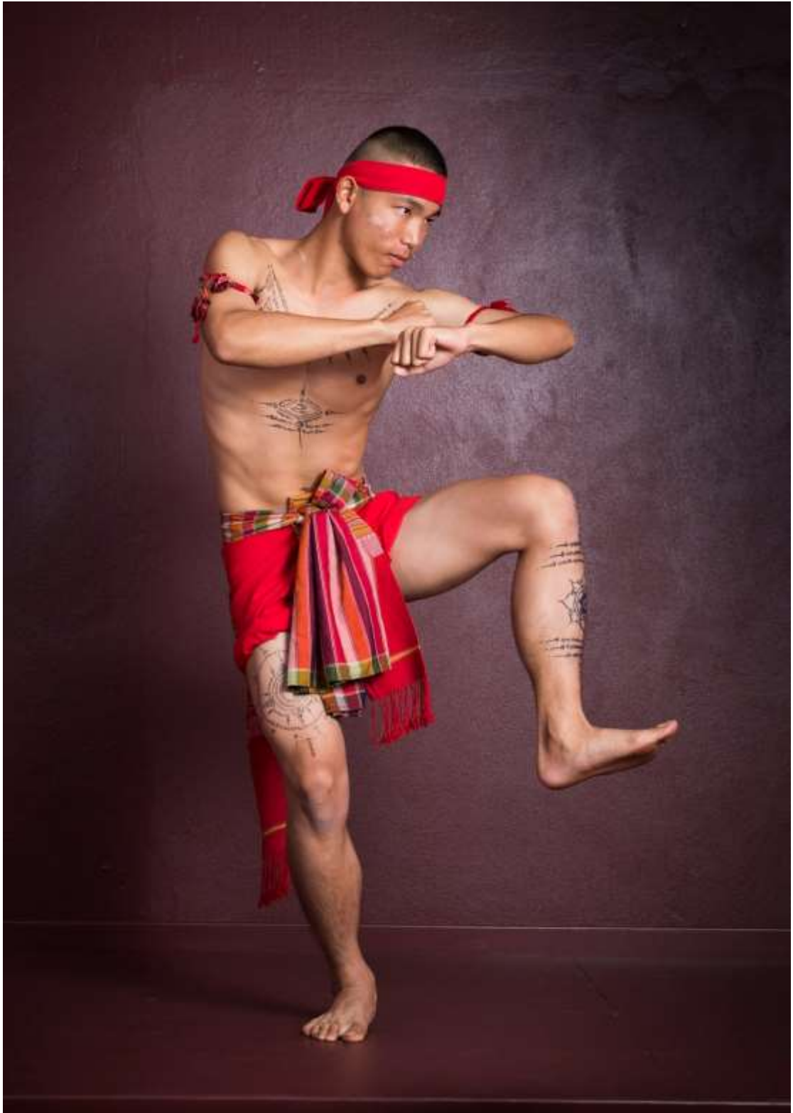
ท่าหมัดกระพี้โรง