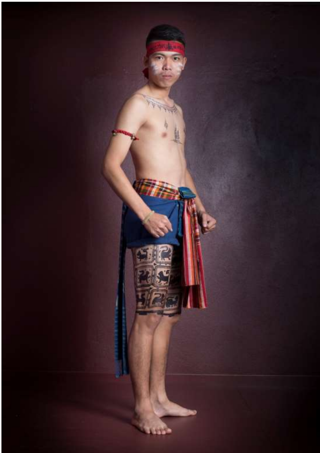
การแต่งกายผู้แสดงรำมวยโบราณสกลนคร