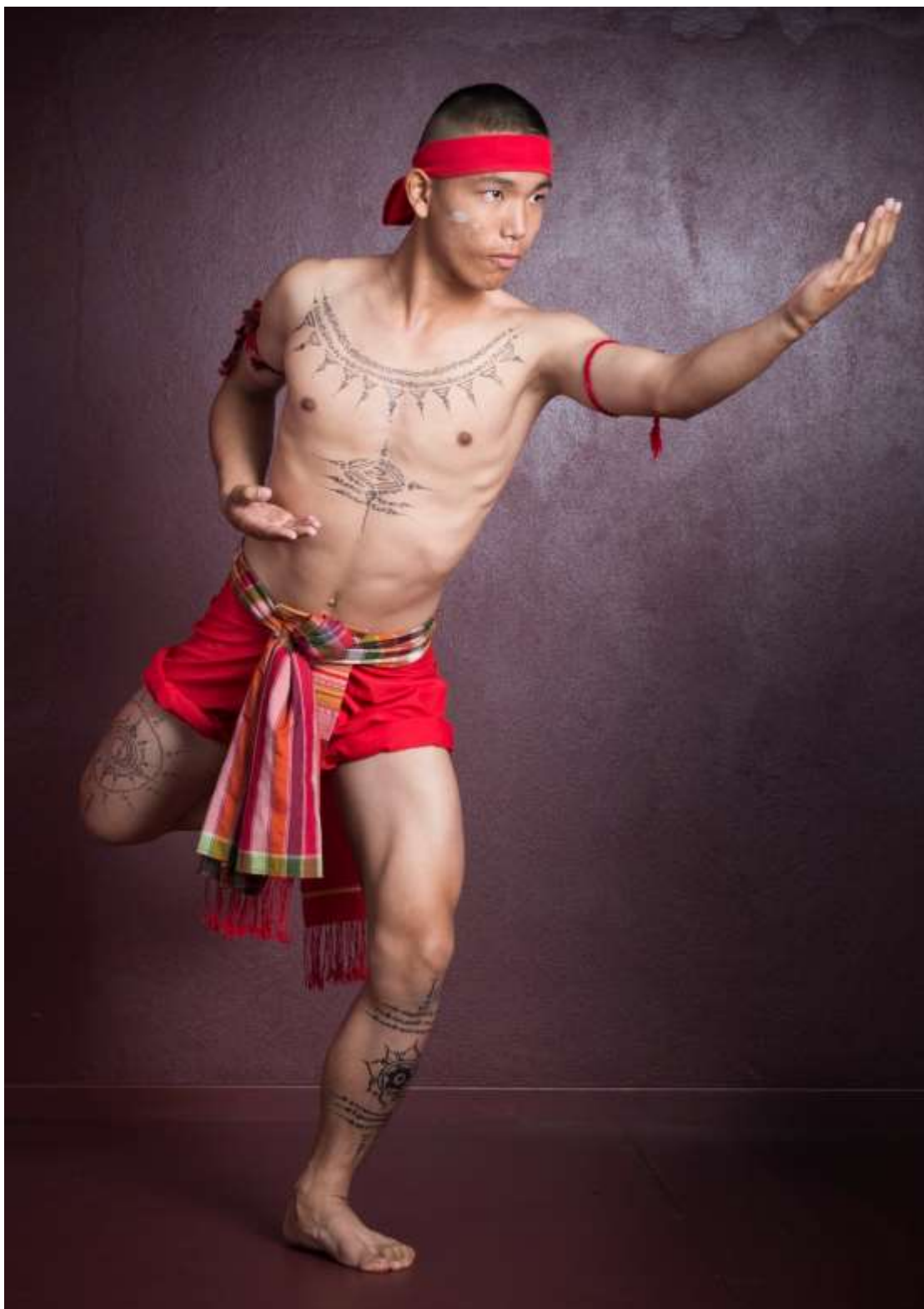
ท่าฟ้าวคัฬศร