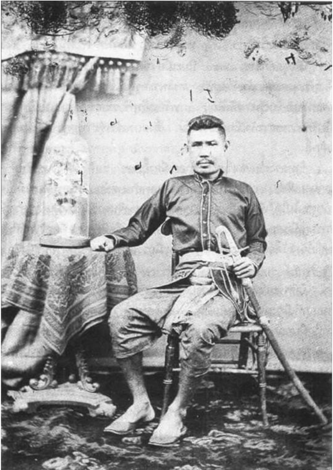
พระยามหาอำมาตยาธิบดี (หรั่ง ศรีเพ็ญ) สมุหหัตไทยฝ่ายเหนือ และอธิราชมนตรีสภา (สภาองคมนตรี)/ผู้ให้เรียนเรียงต้นฉบับ