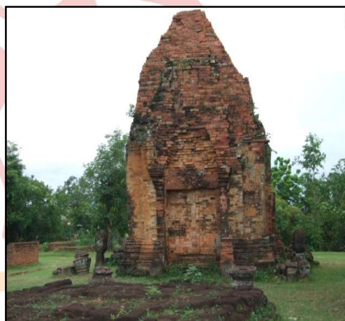
ภาพที่ ๓ พระธาตुเชิงชุมและพระธาตุมุเท็ก พระธาตุมุเท็กที่มีอายุเดียวกับพระธาตุนารายณ์เจงเวง

พระนางนารายณ์เจงเวง : บทบาทในฐานะผู้นำจิตวิญญาณของแม่หญิงแอ่งสกลนคร