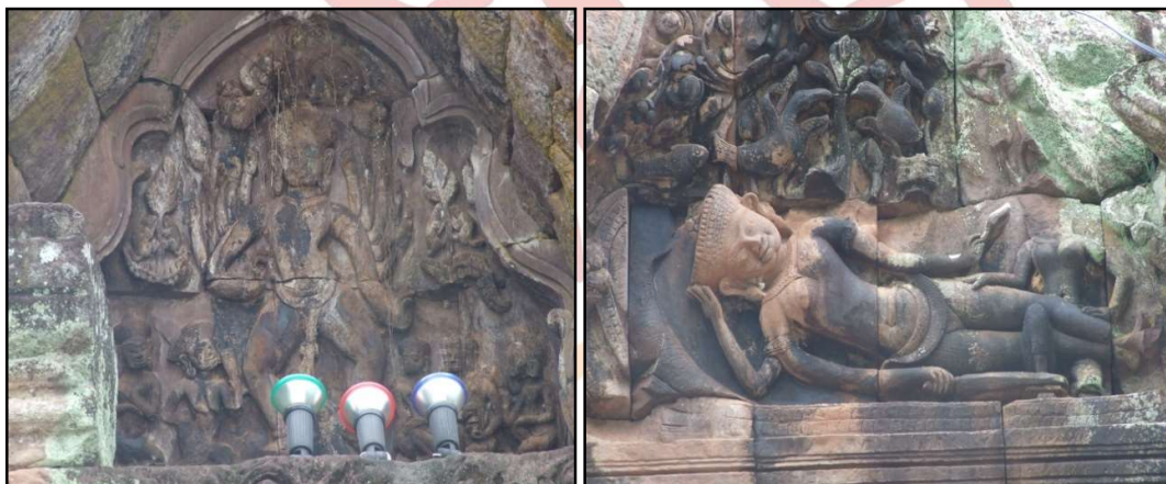
ภาพที่ ๒ พระศิวนาฏราช และนารายณ์บรรทมสินธุ์ ที่ประดิษฐานอยู่หน้าประตูพระธาตุนารายณ์เจงเวง

บทความนี้มีวัตถุประสงค์เพื่อศึกษาบทบาท ของพระนางนารายณ์เจงเวงที่มีต่อชาวเมืองหนองหานหลวง และเพื่อศึกษาภาพแทนพระนางนารายณ์เจงเวงที่มีอยู่ในองค์พระธาตุ ผู้วิจัยตั้งคำถามว่า พระนางนารายณ์เจงเวงเป็นใครกันแน่ จึงสามารถที่จะนำเหล่าผู้หญิงแห่งเมืองหนองหานหลวงก่อเจดีย์ชนะฝ่ายชาย นอกจากนี้พระนางนารายณ์เจงเวงมีบทบาทต่อชาวเมืองหนองหานหลวงอย่างไรจึงสามารถชักชวนให้สร้างพระธาตุให้แล้วเสร็จลงได้ ตำนานพระธาตุนารายณ์เจงเวงมีบทบาทอย่างไรต่อชาวเมืองหนองหานหลวงในขณะนั้น ทำไมพระธาตุนารายณ์เจงเวงเปรียบเหมือนภาพแทนพระนางนารายณ์เจงเวงและแม่หญิงแห่งเมืองหนองหานหลวง ซึ่งผู้วิจัยได้ตั้งสมมติฐานว่า พระนางนารายณ์เจงเวงเป็นธิดาของพระยาขอมแห่งเมืองอินทปัตถนคร และได้สมรสกับพญาสุวรรณภิงคารซึ่งเป็นกษัตริย์ปกครองเมืองหนองหานหลวง พระนางมีบทบาทเป็นวีรกษัตริย์ของชาวเมืองหนองหานหลวง ทรงทำนุบำรุงพระพุทธศาสนา ทำให้มีอิทธิพลต่อชาวเมืองหนองหานหลวงเป็นอย่างมาก พระธาตุนารายณ์เจงเวงจึงเป็นอนุสาวรีย์ของพระนางนารายณ์เจงเวงอันเปรียบเหมือนภาพแทนของพระองค์ และแม่หญิงแห่งเมืองหนองหานหลวง