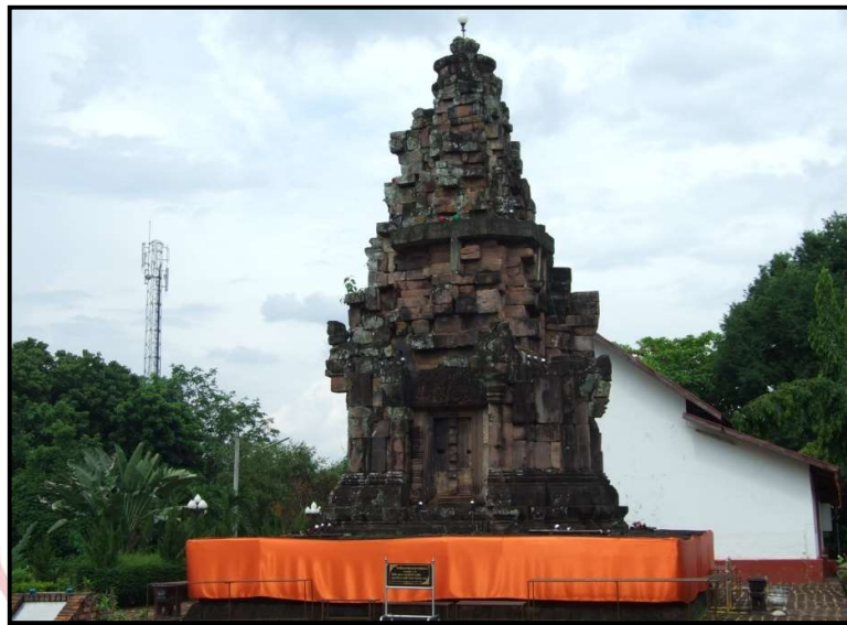
ภาพที่ ๑ พระธาตุนารายณ์เจงเวง ศาสนสถานศิลปะขอมสมัยปาปวน